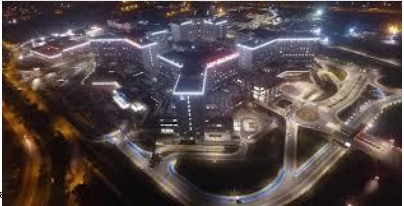
Adana Şehir Hastanesi 16/09/2017