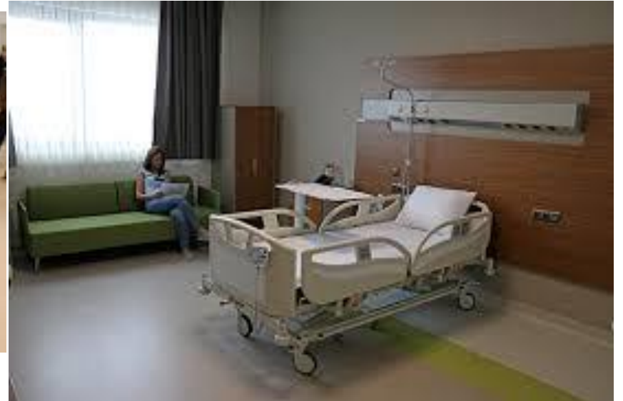
Adana Şehir Hastanesi 16/09/2017