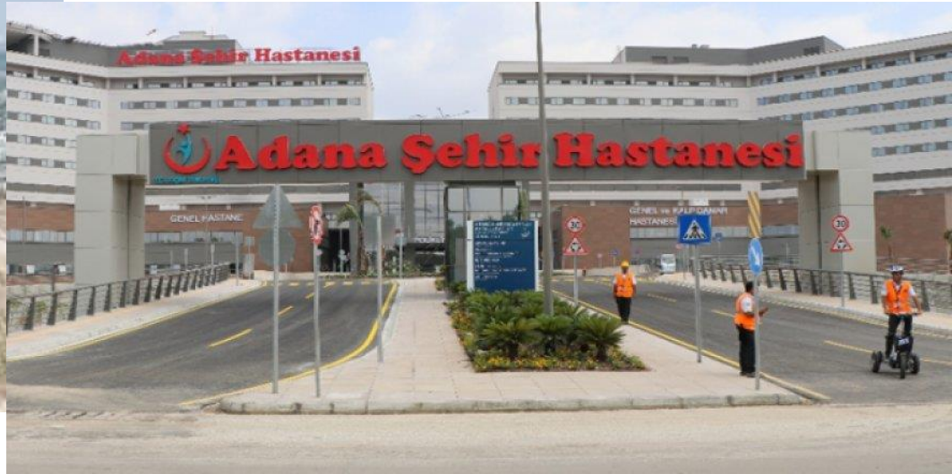
Adana Şehir Hastanesi 16/09/2017