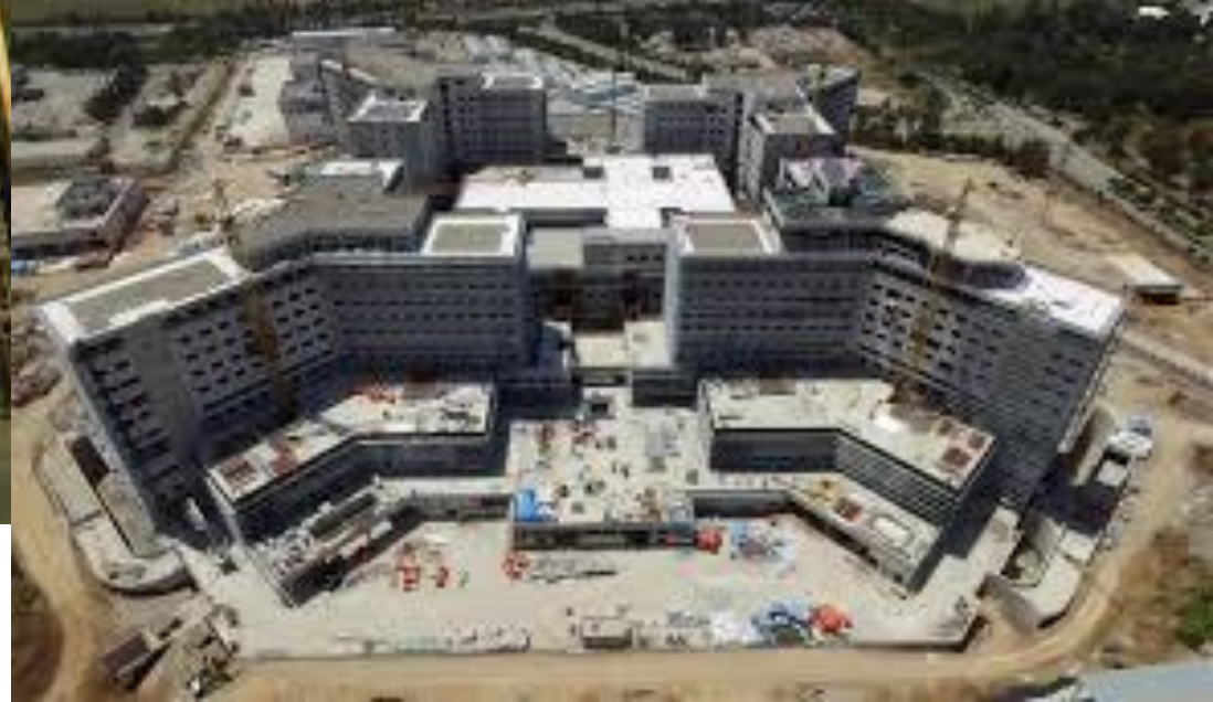
Adana Şehir Hastanesi 16/09/2017