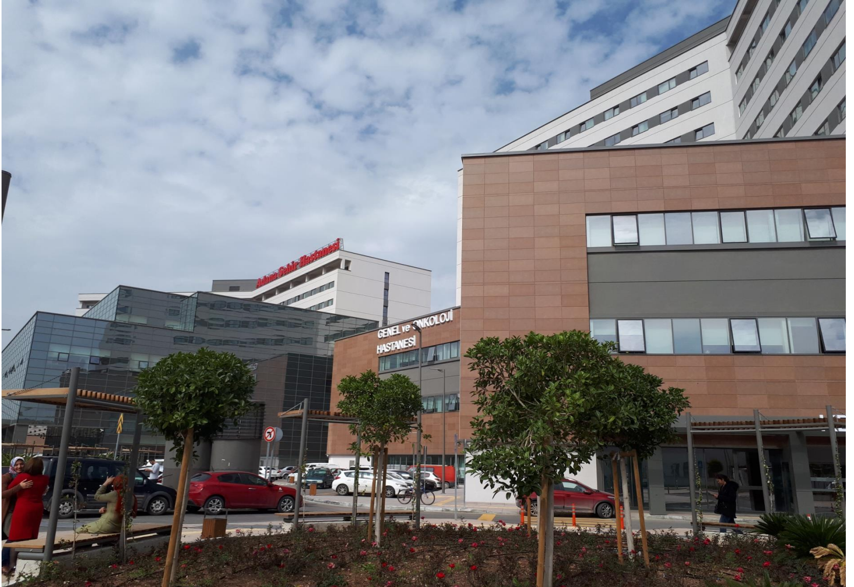
Adana Şehir Hastanesi 16/09/2017