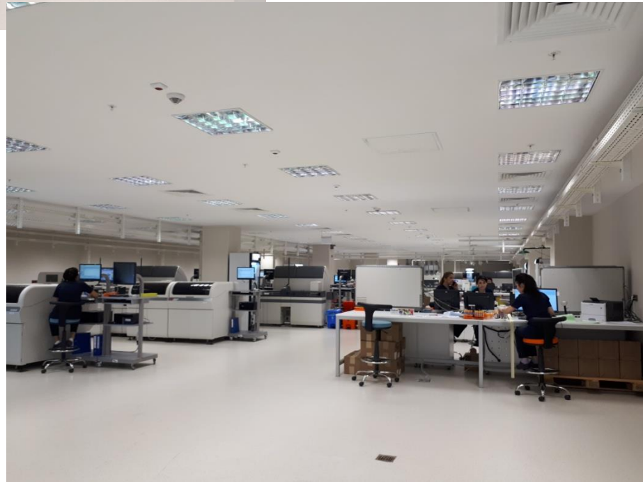
Adana Şehir Hastanesi 16/09/2017