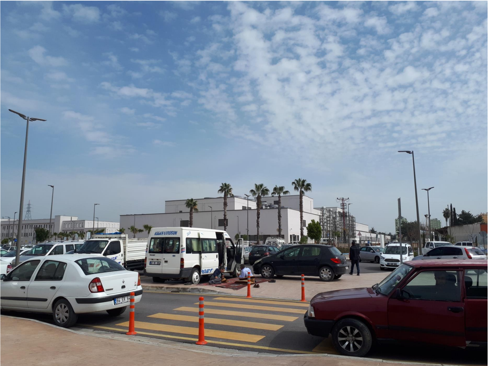
Adana Şehir Hastanesi 16/09/2017